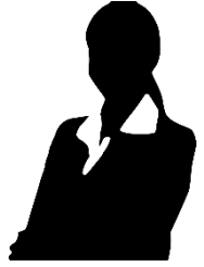
הייג'ר אבו שארב, רכזת תעסוקה